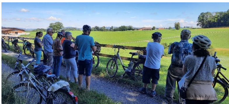
Weilertour mit der Generationenkirche